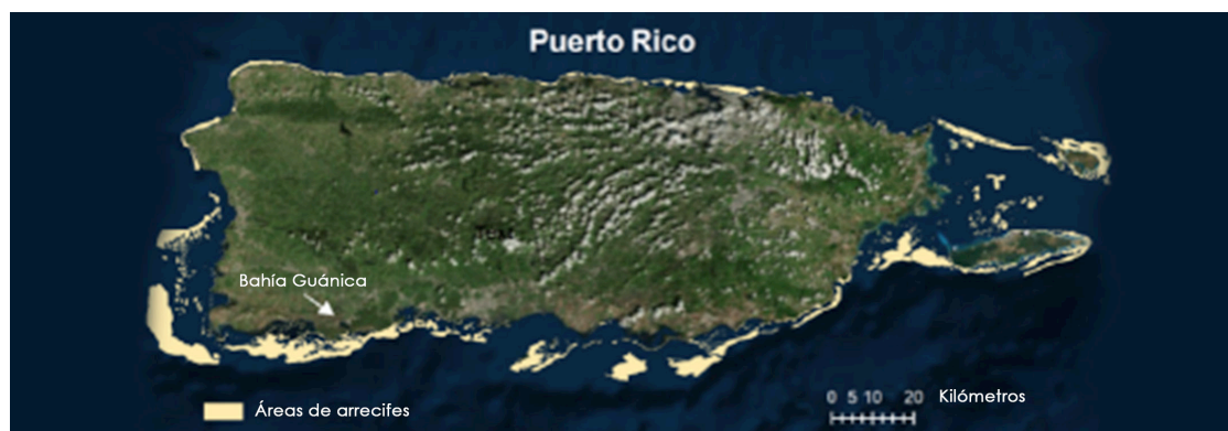
Mapa de Puerto Rico

Al considerar solo a los visitantes que utilizaron los arrecifes, se realizaron 843,651 viajes personados durante el verano y 327,717 viajes personados durante el invierno. Los usuarios de arrecifes coralinos gastaron más de 7.1 millones de días personados recreándose durante el verano y cerca de 2.9 millones de días personados durante el invierno. Un día personado se refiere a la cantidad de días que una persona invierte durante su viaje. Por lo tanto, en un viaje donde la persona esté cinco días, cuenta como cinco días personados. Si hay 3 personas en ese viaje, entonces serían 15 días personados. En un día promedio durante el verano, había un promedio de 4,600 visitantes utilizando el arrecife, mientras que en invierno, 1,800 visitantes utilizaron los arrecifes.